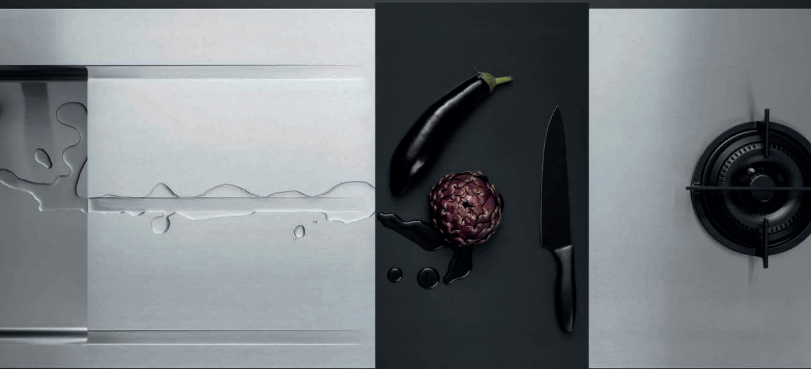
Arbeitsplatte, Spüle mit Ablaufrinnen, Gasbrenner