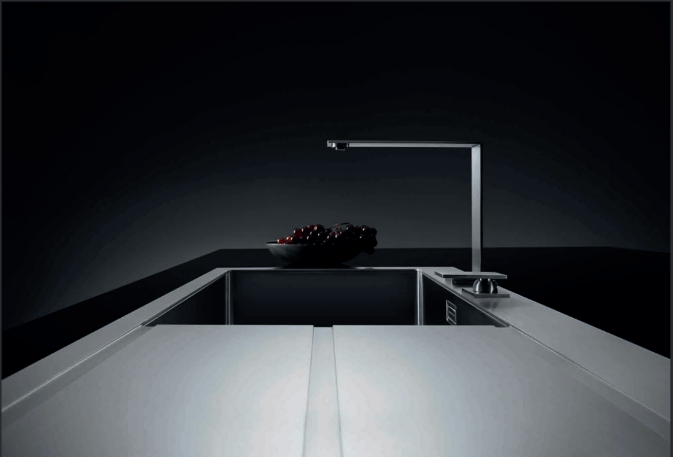
Arbeitsplatte mit eingesetztem Edelstahlbecken