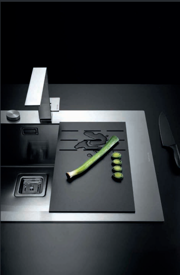
Edelstahlspülen-Modul nach Kundenwunsch auf Maß gefertigt mit eingefrästen Tropfteil.