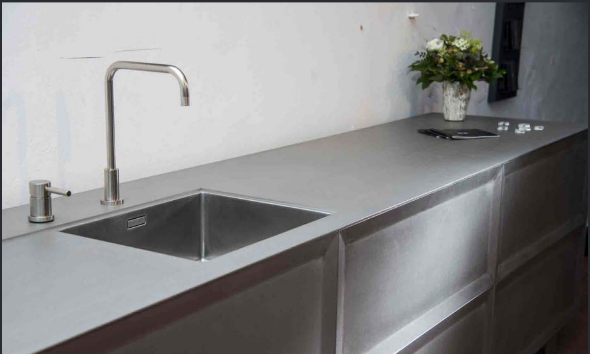
silverTouch Arbeitsplatte 5 mm mit flächenbündig eingeschweißtem Becken im gleichen Finish.