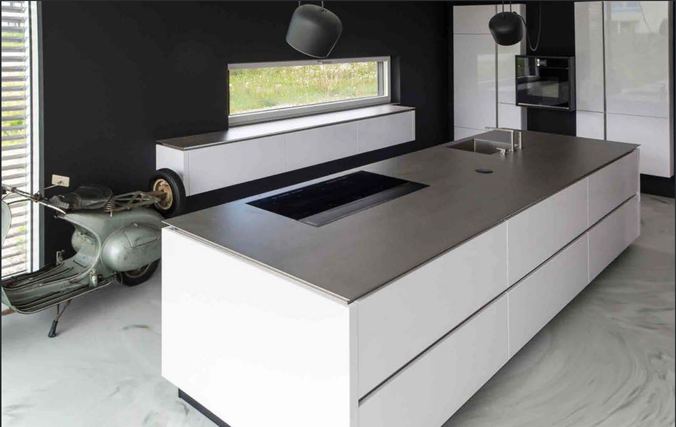
Kochinsel 370 x 110 cm mit silverTouch Arbeitsplatte. Ausstattung Querstromlüfter EVO 01 und Induktionskochfeld KIS 100. Hinten links flächenbündig eingeschweißtes Becken im gleichen Oberflächen Finish, Design-Armatur und Seifenspender.