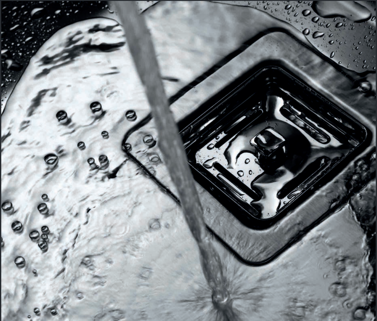
Edelstahleinbaubecken mit quadratischem Ablauf