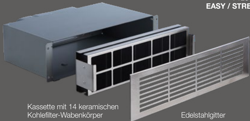
Kassette mit 14 keramischen Kohlefilter-Wabenkörper