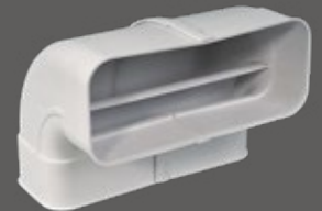
vertikale Flachkanalbögen 2 Stück